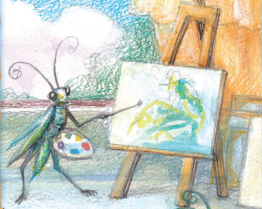
Художник Юрий Юрасов