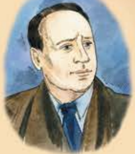
Евгений Львович Шварц

(1896-1958 гг.), русский писатель, сценарист, драматург, журналист и поэт.